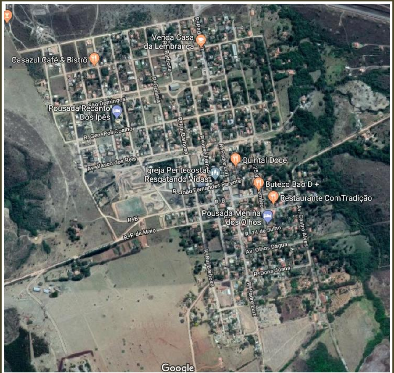
Distrito de Olhos D'Água - Alexânia/GO